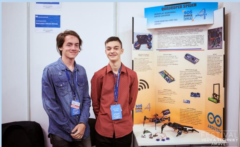
Celoštátna prehliadka Festivalu vedy a techniky AMAVET

Úspechy našich žiakov sú úspechmi celej školy.