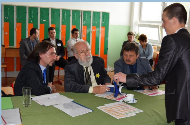
Celoštátne kolo súťaže ENERSOL