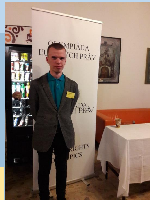
Celoštátne kolo Olympiády ľudských práv